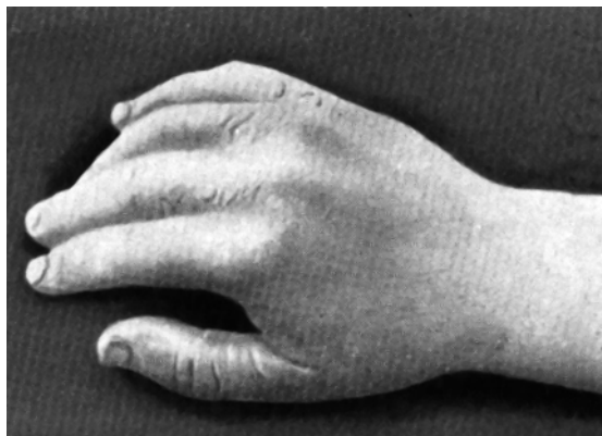
Mâna dreaptă a lui Anton Rubinstein văzută din lateral