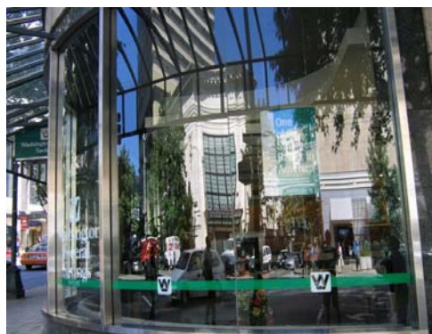
Fig. 2 – Centrul comercial Nordstrom, Seattle

Transparența clădirii, posibilitatea de a privi înăuntrul ei, lumina, simbolizează chiar puterea și structura ei deschisă. Metalul și sticla, semnificând suplețe, claritate a structurii, transparență, sunt folosite adesea ca semn. Arhitectura a devenit spațiu de viață. Ea este justificarea prin estetizare a cuceririi lumii, căci o construcție frumoasă nu mai este un simplu element prin care omul face să dispară o bucățică din mediul natural, ci o componentă a culturii.