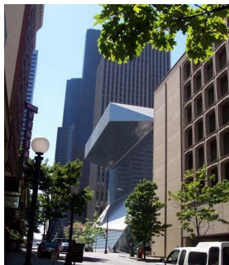
Fig. 4 – Biblioteca publică, Seattle

Ba mai mult, dorința de a simți verdele peste tot, a condus la soluții ingenioase. Una din sălile de lectură a bibliotecii publice din Seattle, este “încălzită” de o imensă mochetă ce îți dă senzația că rafturile cu cărți se află în grădina casei.