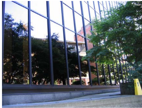
Fig. 7– Centru comercial Macy's, Seattle

Un element remarcabil sunt pasarelele construite între clădiri la diferite etaje, care fac de altfel și legătura între străzi.