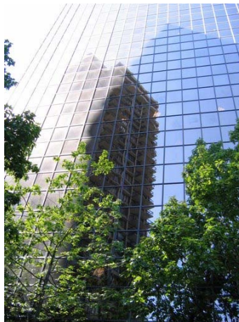
Fig. 11 – Centru de afaceri, Seattle

Soluții ingenioase de captare a luminii naturale găsim atât în spațiul public cât și în cel privat. Luminatoarele înlocuiesc lumina artificială unde este posibil acest lucru, fiind de bun augur și din punct de vedere economic. Și clima permite în această zonă acest artificiu, acoperișurile nefiind obligate să suporte cantități mari de zăpadă. Clădirile din downtown-ul (centrul) unui oraș american se dezvoltă - cum am mai spus - mai mult pe înălțime, în timp ce spațiile de locuit, fie că sunt locuințe personale, sau complexe de mai multe clădiri, au cel mult câteva etaje. Ai spune că după opt sau zece ore de muncă fără să atingi pământul, ba mai mult, să fii și cam departe de el, curtea din spatele casei, gazonul sau chiar