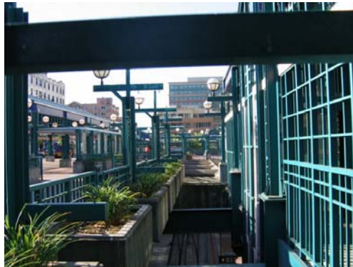
Fig. 8 – Pasarelă, Seattle

Un element remarcabil sunt pasarelele construite între clădiri la diferite etaje, care fac de altfel și legătura între străzi.