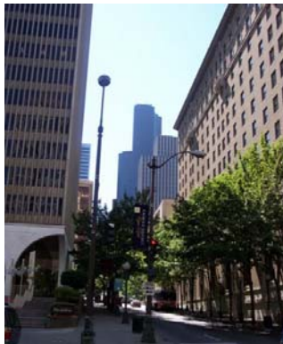
Fig. 3 – Down Town, Seattle

Unii se bucură așadar de o atmosferă mai curată, conștientizând în același timp că un brad “cruțat” într-un șantier din mijlocul orașului, nu mai este privit ca un element separat din natură, ci ca un concept de devenire a oricărui loc. Grijă pentru natură este atât de mare încât în alte părți acest fapt ar stârni cel puțin rumoare.