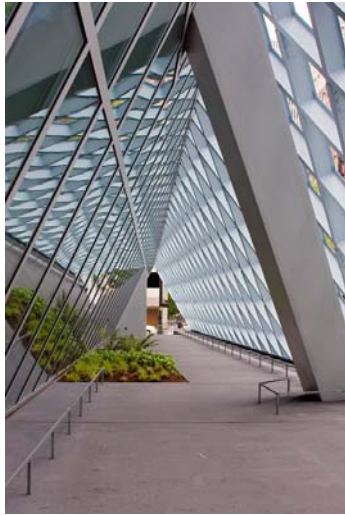
Fig. 6 – Biblioteca publică, Seattle

Coasta de vest a Statelor Unite este mult diferită de cea de est. Mai rarefiată ca populație, zonele urbane nu se remarcă prin clădiri foarte înalte. Seattle, capitala statului Washington are o singură clădire mai înaltă, Columbia Tower, care este de altfel și cea mai înaltă clădire de pe coasta de vest. Seattle are o poziție naturală atât de spectaculoasă, încât o concepție arhitecturală radicală apare ca excesivă în raport cu ambientul natural. Zgârie-norii geometrici, se combină perfect cu natura. Ba chiar ai spune că au fost construiți ei pentru a completa bogăția peisajului și nu invers. Iar vegetația face parte din ambient, tot atât de mult ca și un obiect de artă. Acolo unde nu mai este loc pentru elemente ale naturii, oglindirile ajută la înmulțirea lor.