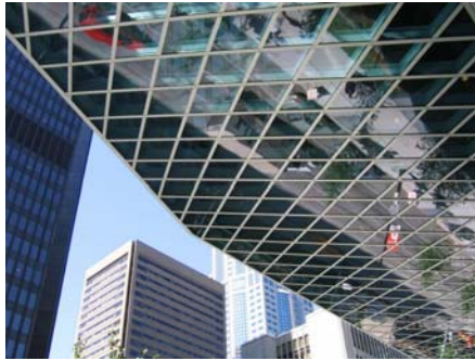
Fig. 9 – Oglindire, Biblioteca publică, Seattle

De fapt, arhitectura americană nu are nimic rece sau impersonal, chiar dacă materialele folosite ar putea infirma acest lucru. Sticlă și oțel, alternanțe de brunuri, griuri și albastru, lumina naturală exploatată la maxim, totul combinat cu verdele cald al plantelor ornamentale. Acestea sunt amplasate strategic, punând în valoare spațiile. Oglindirile sunt căutate chiar dacă aparențele par a fi hazardate. Ceea ce se vede într-o oglindă nu este întâmplător, are în primul rând rolul de a conduce privirea, de a informa și nu în ultimul rând de a crea plăcere estetică.