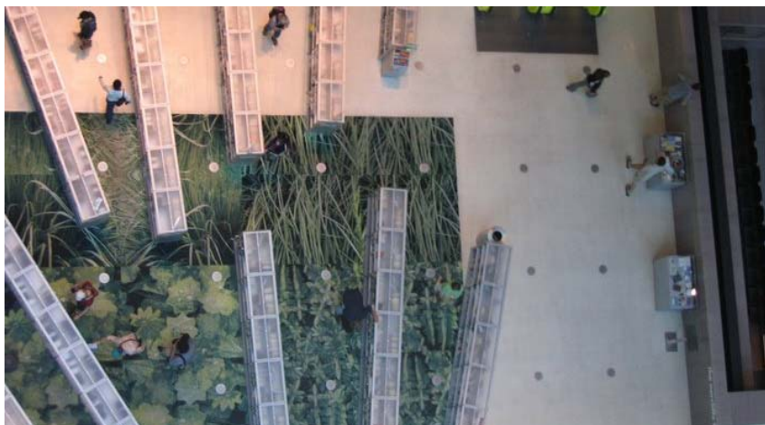
Fig. 5 – Biblioteca publică, sală de lectură, Seattle

Ba mai mult, dorința de a simți verdele peste tot, a condus la soluții ingenioase. Una din sălile de lectură a bibliotecii publice din Seattle, este “încălzită” de o imensă mochetă ce îți dă senzația că rafturile cu cărți se află în grădina casei.