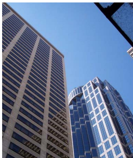
Fig. 1 – Down Town, Seattle

fost gazda așa numitelor "renașteri" care au însemnat reproducerea unor stiluri din perioade diferite ale arhitecturii mondiale, prin care multiculturalitatea societății americane și-a spus cuvântul 1 . Sticla, nichelul, atmosfera clară, lumina, curățenia, reprezintă apanajul arhitecturii americane contemporane.