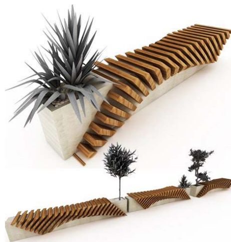
Fig. 7 - Mobilier modular destinat spatiilor urbane [5]