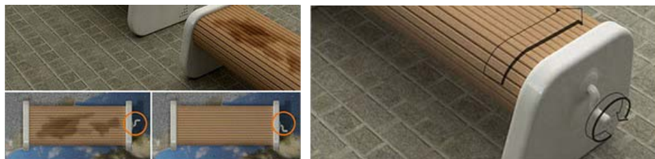
Fig. 6 – Soluție pentru întreținerea mobilierului urban [5]

Rolul designerului este definitoriu în proiectarea și amplasarea mobilierului urban prin înfrumusețarea și optimizarea spațiului (fig.5). Designul mobilierului răspunde dorinței de confort al cetățenilor și turistilor orașului, simplificând viața urbană modernă (fig.6, fig.7).