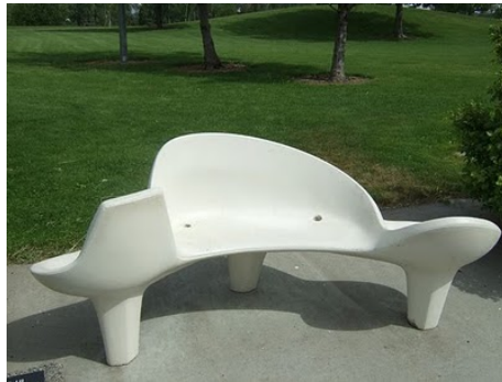
Fig.3 – Element de mobilier modular pentru socializare [5]