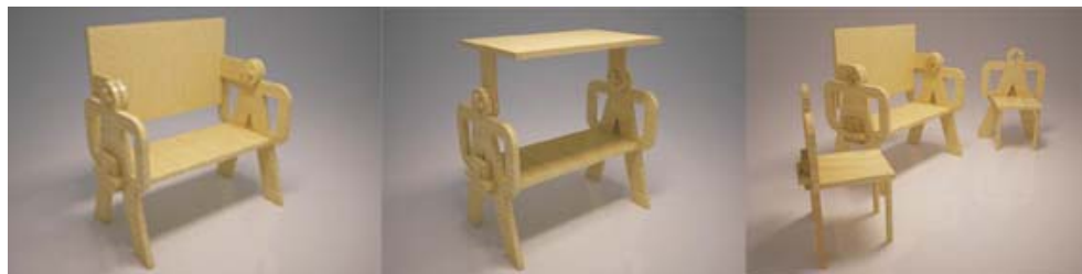
Fig. 10 – Concept banca ecologica, traditionala, multifunctionala, fara elemente de asamblare suplimentare (concept Balan Ilarion)

Pentru a raspunde cerintelor ecoproiectarii vizand grija fata de mediu, conceptul prezentat in fig.10 prezinta o banca fara elemente de asamblare suplimentare. Conceptul, multifunctional, realizat din material natural (lemn), se incadreaza in trendul actual al grijei fata de mediu, natura, utilizator si fabricant deopotriva.