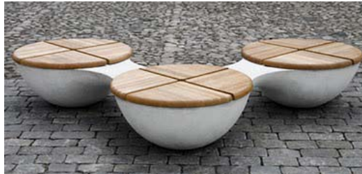
Fig.2 – Elemente de mobilier modular pentru socializare [5]