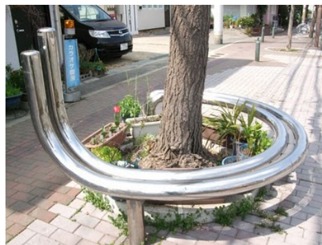
Fig.4 – Element de mobilier încadrat în peisajul urban [5]