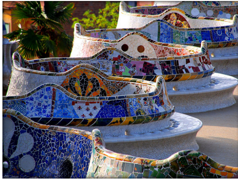
Fig. 1 –Gaudi - Parcul Guell, Barcelona [5]

Element de mobilier de referință, bancile din parcuri au început să existe odată cu apariția primelor spații verzi destinate relaxării și odihnei. În culturile marilor civilizații ale Greciei antice, imperiilor Roman și Persan, bancile din grădini erau construite din marmură sau alte pietre.