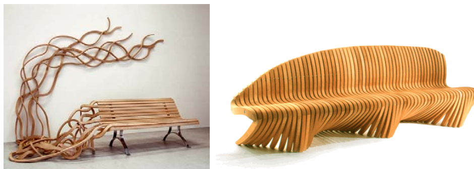
Fig.5 – Relationarea mobilierului cu peisajul urban [5]

Realizarea bancilor din diferite alte materiale a debutat spre sfârșitul secolului XIX, înlocuind astfel bancile clasice din lemn și piatră. Alături de bănci au fost create și alte tipuri de obiecte posibil a fi folosite pentru odihna colectivă precum: banchetele, gradenele, bordările spațiilor verzi, etc (fig.4). În prezent se considera ca dezvoltarea urbana este asociată și cu dezvoltarea mobilierului urban și a componentelor lui. Mobilierul urban reprezintă un element de confort al spațiilor publice, un element de strictă necesitate, indispensabil tuturor localităților urbane sau rurale. [3]